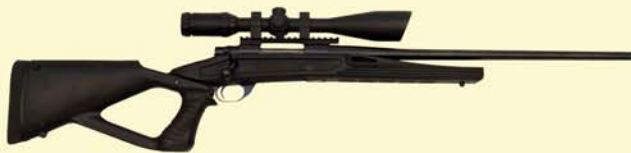
Ambi Talon Varminter