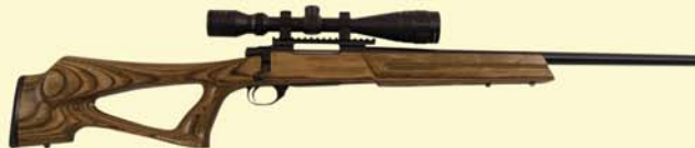
Ambi Thumbhole Varminter Nutmeg